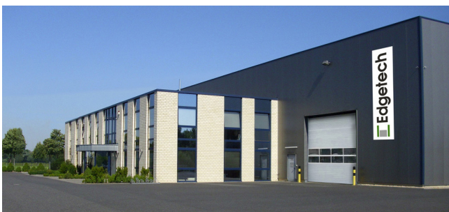
Firmengebäude der Edgetech Europe GmbH in Heinsberg.